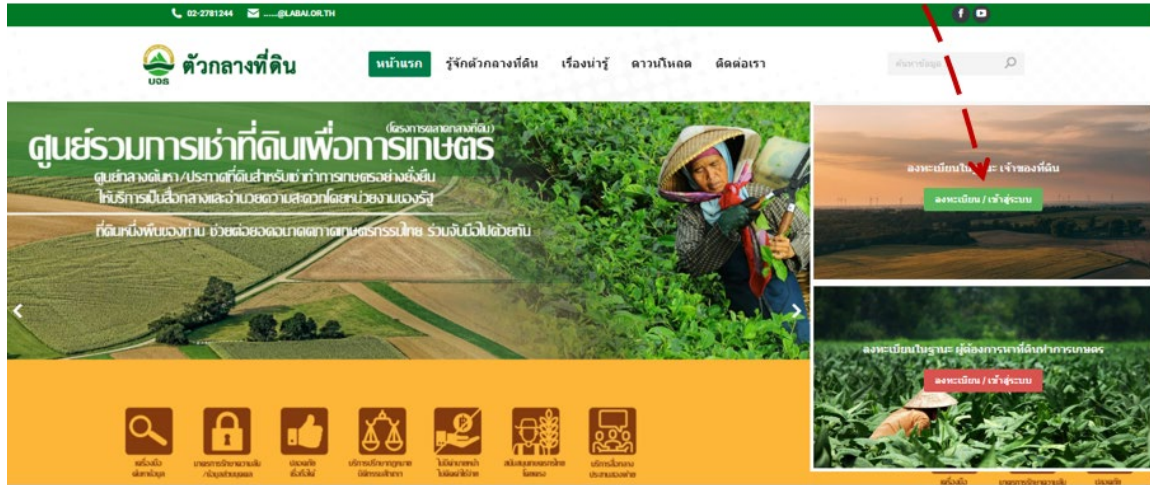
ภาพที่ 1 การลงทะเบียนเพื่อเข้าใช้งานระบบสำหรับเจ้าของที่ดิน